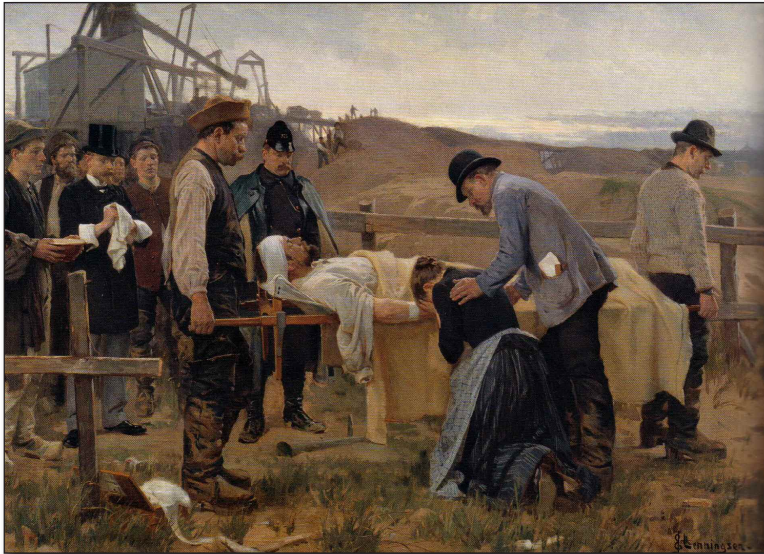
Maleri af Erik Henningsen. Statens Museum for Kunst.

Foredrag af cand. jur. Jørgen Green © 2018